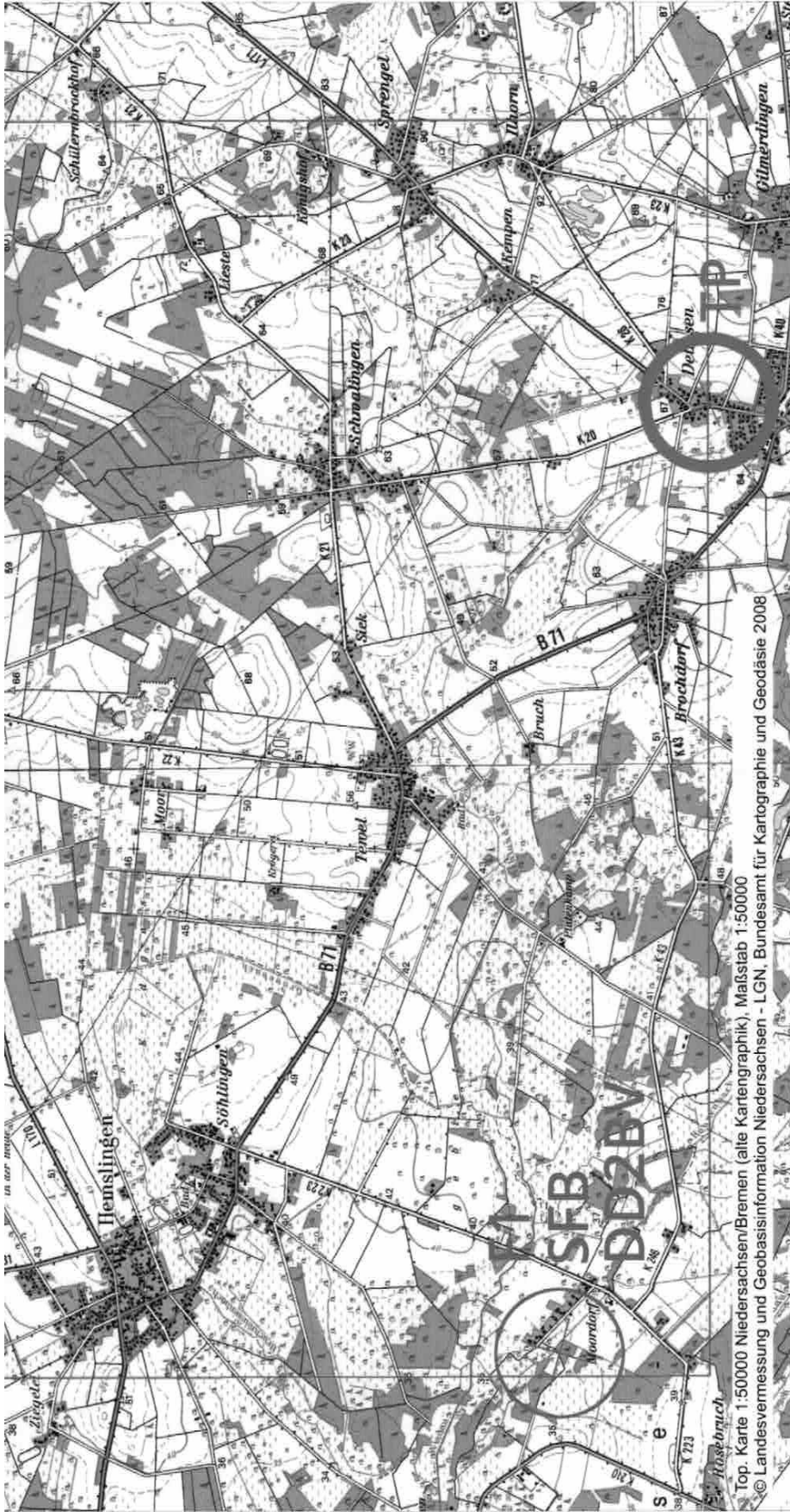
Top. Karte 1:50000 Niedersachsen/Bremen (alte Kartographie), Maßstab 1:50000 © Landesvermessung und Geobasisinformation Niedersachsen - LGN, Bundesamt für Kartographie und Geodäsie 2008